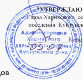
Схема размещения мест (площадок) накопления твердых коммунальных отходов д. Ханхатуй Харикского сельского поселения Куйтунского муниципального района Иркутской области