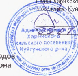
Схема размещения мест (площадок) накопления твердых коммунальных отходов д. Аршан Харикского сельского поселения Куйтунского муниципального района Иркутской области